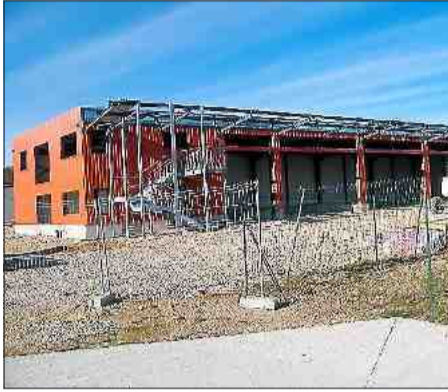
■ Le garage intercommunal sera en service dès cet été.

Le coût de la construction est de 700 000 € HT, financés pour 3% par une réserve parlementaire, 43% par le