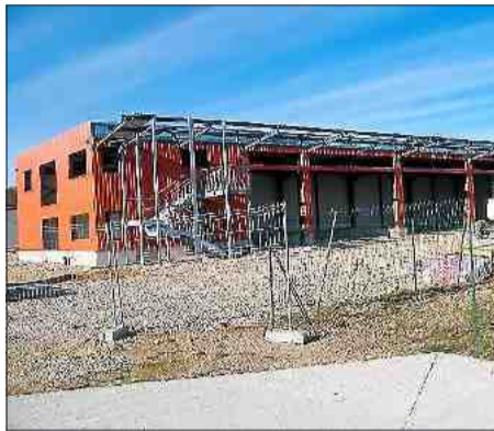
■ Le garage intercommunal sera en service dès cet été.

Le coût de la construction est de 700 000 € HT, financés pour 3% par une réserve parlementaire, 43% par le