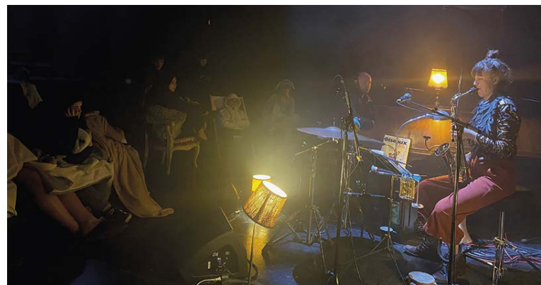
Veillée de L'Oiseau Ravage - Février 2025