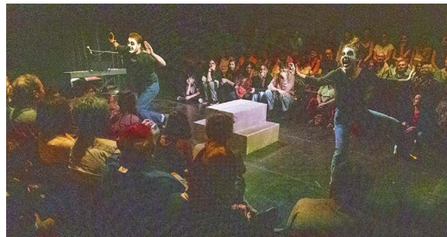
Ce moment-là ! Théâtre Albarède - Mai 2025.

Elle nous invitera à aller voir dans le passé comment ça se passait, quel était le fonctionnement de la démocratie directe à Athènes au V ème siècle. Elle souhaite travailler l'articulation entre la naissance du théâtre occidental sous sa forme tragique et la naissance de la démocratie.