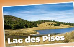
Lac des Pises